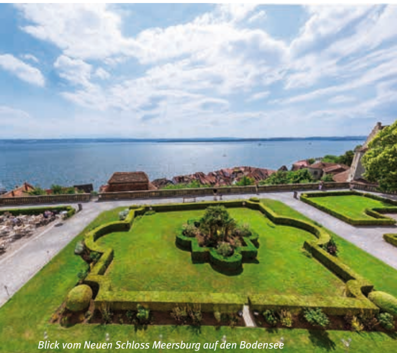
Blick vom Neuen Schloss Meersburg auf den Bodensee

schloss@wartegg.ch | www.wartegg.ch | www.warteggkultur.ch